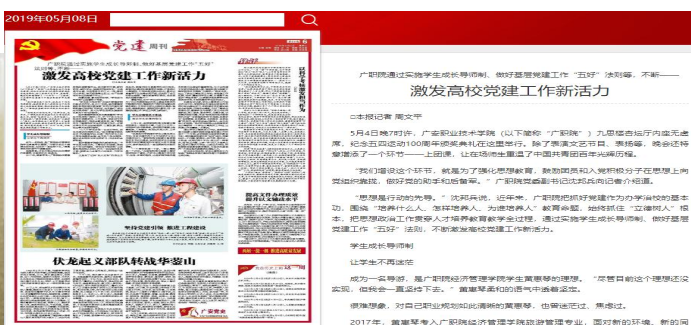
(图 2 广安日报报道)