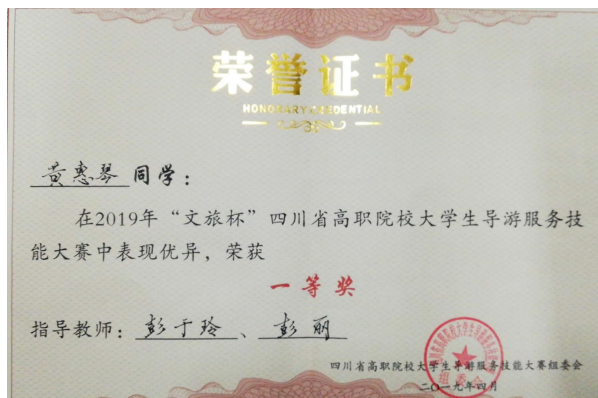
(图 6 四川省大学生竞赛一等奖)