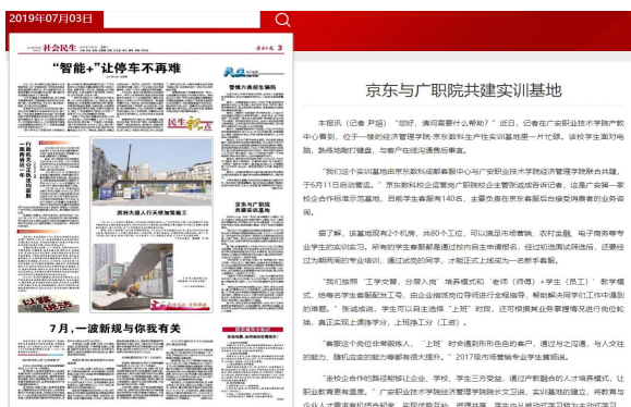
(图 3 广安日报报道)

二. 理实一体、双创课堂： 我们始终将“双创”教育贯穿人才培养全过程。旅游管理专业走进邓小平故里景区，华蓥山景区，实施情景教学，把景区当讲堂，把景点当课堂；传承红色文化、弘扬革命精神。电商物流、市场营销专业与京东、广安市快递协会共建京东生产基地和校园快递超市，会计专业与民建一支部项目合作，让学生直接实战，培养学生创新意识和创业能力。邀请全国十大杰出青年农民，四川省劳模、民营企业家居阳晓玲为“双创”导师，多方携手，推进产教融合；红色旅游专业群技术引领、文化育人模式成效显著。