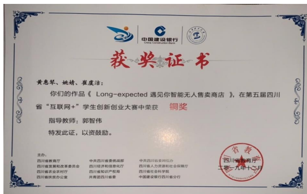
(图 5 四川省教育厅双创获奖证书)

三. 技术引领，精彩纷呈：技术文化入脑入心，双创项目热情高涨，蔚然成风。2018-2019 省级互联网+红色筑梦之旅创新项目 5 项，2019 四川省级大学生创新创业计划立项 7 项；2020 年省级互联网+创新创业项目 3 项，四川省级大学生创新创业项目立项 2 项。