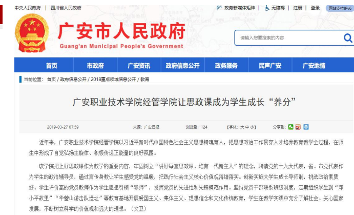
(图 4 市政府网站报道)