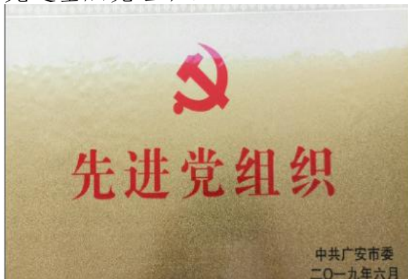
(图 1 广安市委表彰)

一. 思想先导，文化先行： 以党建为抓手，强化政治文化建设，实现理论创新。组织保障更加有力，干部四化更加凸显，教师三力明显增强。学院被中共广安市委表彰为 2018-2019 年先进党组织，被学校党委表彰为 2019-2020 年先进基层党组织。