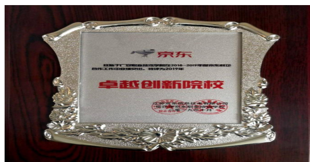
(图 10 京东集团授予荣誉)